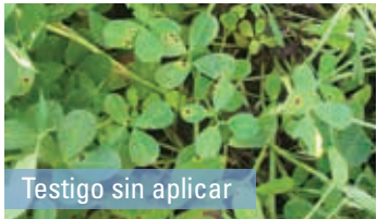
Testigo sin aplicar