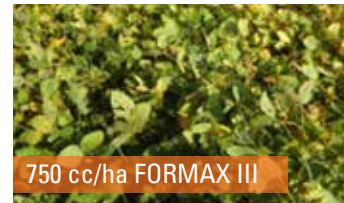
750 cc/ha FORMAX III

DOSIS: 0,75 L/ha + 0,5 L/ha de ZINAX (EMAG).