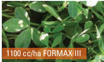
1100 cc/ha FORMAX III