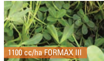
1100 cc/ha FORMAX III

DOSIS: 1,1 L/ha + 0,5 L/ha de ZINAX (EMAG).