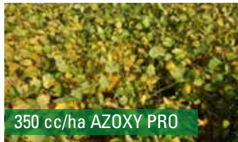
350 cc/ha AZOXY PRO